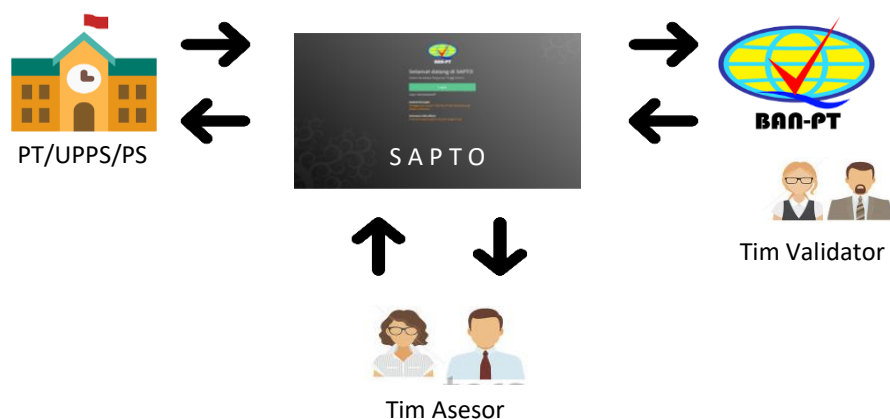
Gambar 1. Diagram Proses Akreditasi

Evaluasi dan penilaian dalam rangka akreditasi program studi dilakukan melalui mekanisme penilaian sejawat ( peer review ) oleh Tim Asesor yang terdiri atas dosen dan para pakar dalam bidang keilmuan program studi yang memahami hakikat penyelenggaraan maupun pengelolaan program studi. Proses akreditasi melibatkan perguruan tinggi, unit pengelola program studi, BAN-PT, asesor dan validator yang difasilitasi oleh program aplikasi SAPTO (Sistem Akreditasi Perguruan Tinggi On-line). Keterkaitan antar pihak yang terlibat dalam siklus proses akreditasi program studi digambarkan dalam diagram berikut (Gambar 1).